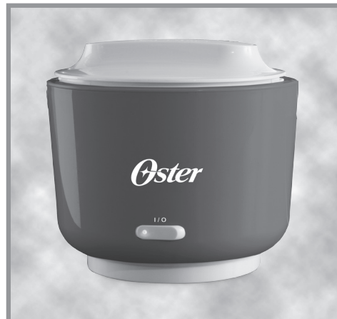
美國Oster®隨行電子保溫飯盒